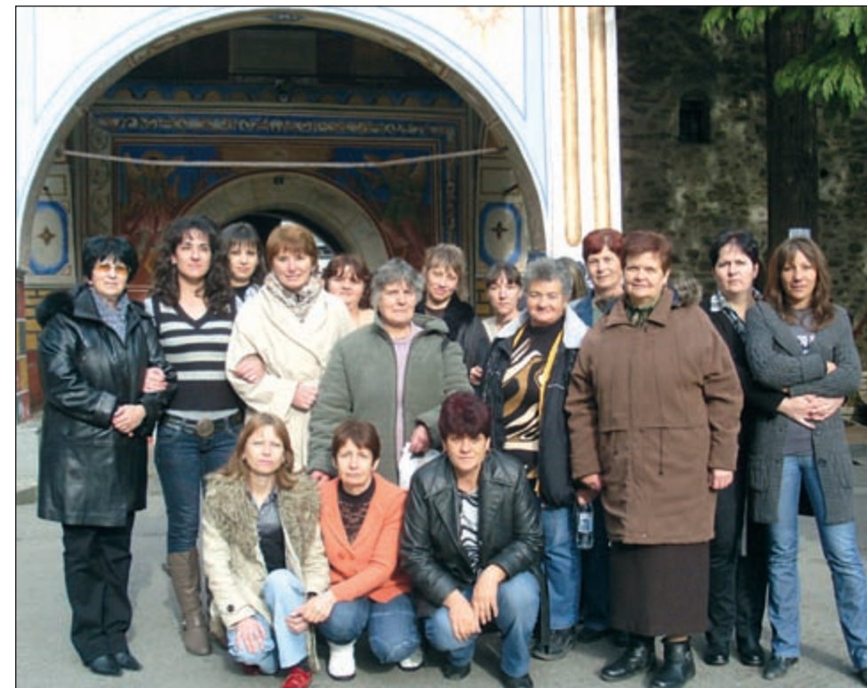
Колективът на кооперацията на обмяна на опит

Кооперацията доставя качествени стоки на конкурентни цени от базата на РКС - Плов-