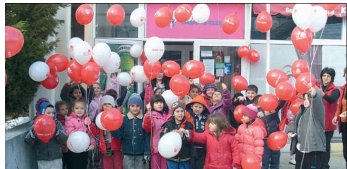
Обеляване старта на 2012 - Международната година на кооперациите на 12.01.2012 г.